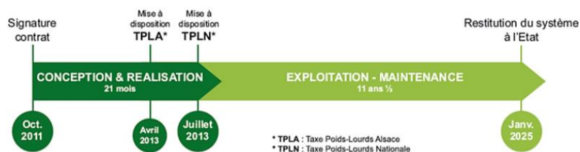
Schéma n° 2 : calendrier contractuel de mise en œuvre de l'écotaxe poids lourds