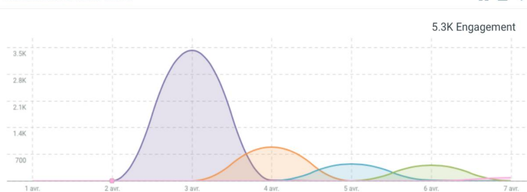
ENGAGEMENT DANS LE TEMPS